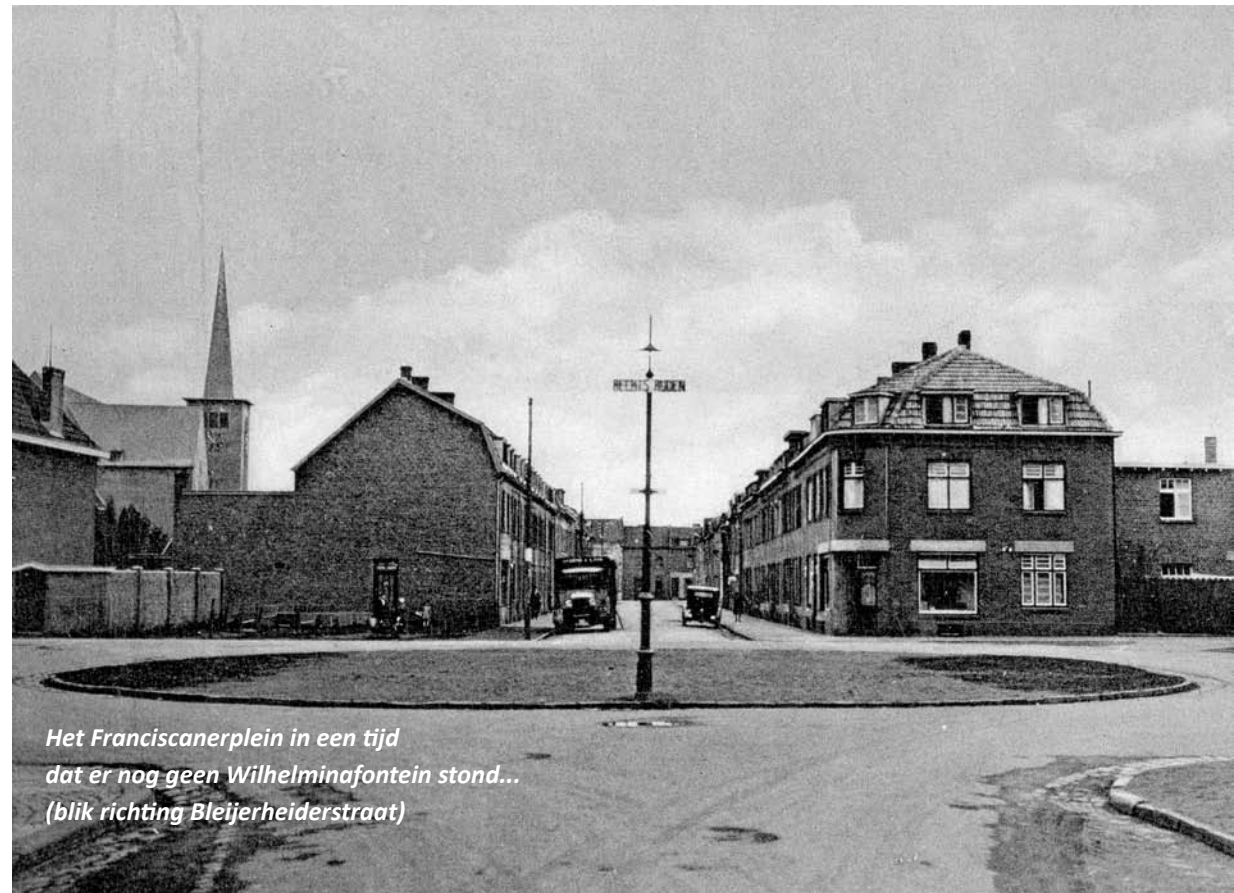
Het Franciscanerplein in een tijd dat er nog geen Wilhelminafontein stond... (blik richting Bleijerheiderstraat)